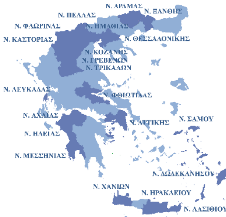
Εικόνα 1. Η γεωγραφική εξάπλωση του Δικτύου στα δύο πρώτα έτη λειτουργίας του. Στο Δίκτυο συμμετείχαν σχολεία από τους νομούς: Αττικής, Αχαΐας, Γρεβενών, Δράμας, Δωδεκανήσου, Ηλείας, Ημαθίας, Ηρακλείου, Θεσσαλονίκης, Καστοριάς, Κοζάνης, Λασιθίου, Λευκάδας, Μεσσηνίας, Ξάνθης, Πέλλας, Σάμου, Τρικάλων, Φθιώτιδας, Φλώρινας και Χανίων.