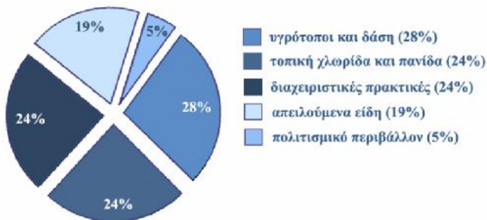
Σχήμα 2. Ποσοστιαία αναλογία στη θεματολογία των προγραμμάτων που υλοποιήθηκαν από τις περιβαλλοντικές ομάδες του Δικτύου

Όσον αφορά στη θεματολογία των προγραμμάτων που συνιστούν το Δίκτυο, 16 περιβαλλοντικές ομάδες ασχολήθηκαν με τη βιοποικιλότητα γειτονικών δασικών και υγροτοπικών εκτάσεων, 14 με τη μελέτη της τοπικής χλωρίδας και πανίδας, 14 με διαχειριστικές πρακτικές (πρακτικές μείωσης της ρύπανσης, καλλιέργειες, προστατευόμενες περιοχές, οικοτουριστική ανάπτυξη κ.ά.), 11 με απειλούμενα είδη και 3 με στοιχεία της τοπικής πολιτισμικής ποικιλίας (σχήμα 2). Η πλειοψηφία των περιβαλλοντικών ομάδων διαφοροποίησε το θέμα του προγράμματος κατά το δεύτερο έτος συμμετοχής στο Δίκτυο.