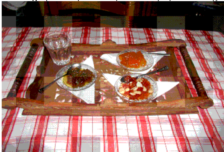
Φωτογραφία 4: Παραδοσιακά γλυκά από την ομάδα εστίασης