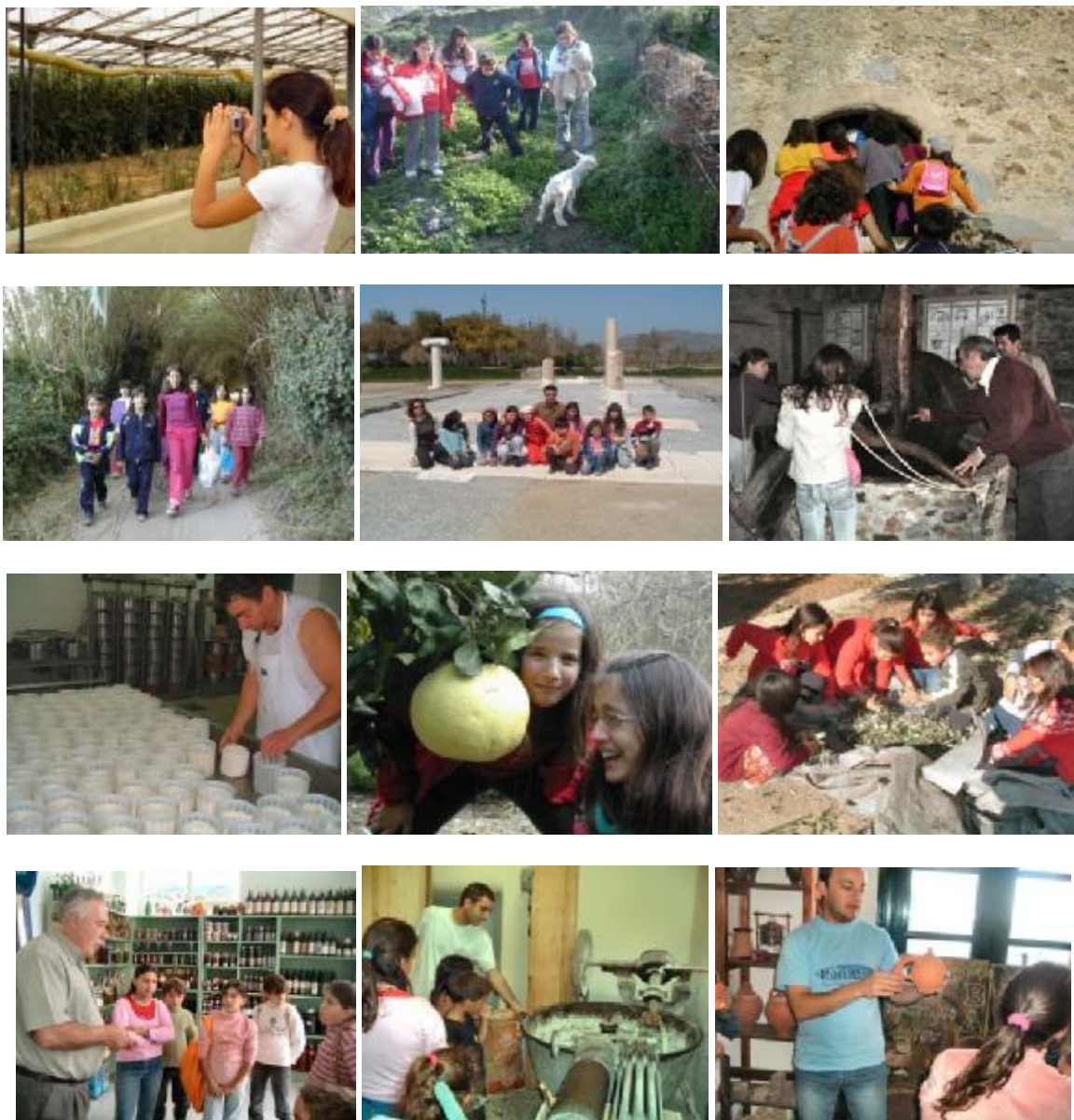
Φωτογραφία 3: Το πρόγραμμα εν δράση

Προς τη λήξη του σχολικού έτους ασχολούμαστε με την προετοιμασία της εκδήλωσης-παρουσίασης του προγράμματος η οποία πραγματοποιείται με μεγάλη επιτυχία στις 15 Ιουνίου το βράδυ.