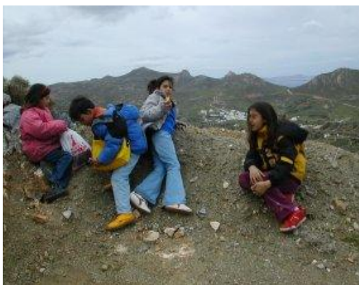
Φωτογραφία 1: Αγναντεύοντας το χωριό Εγγαρές από ψηλά