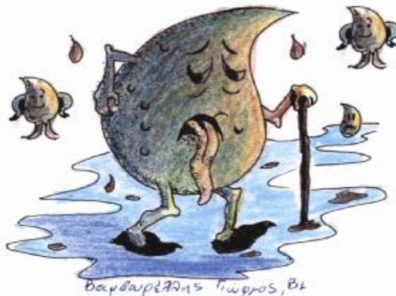
Εικόνα 9. Τα απόβλητα πηγαίνουν στη θάλασσα

Ø Το Γλωσσάρι της Π.Ε.: αναφορά, επεξήγηση, εξοκείωση με την ορολογία της Π. Ε. και τα περιβαλλοντικά προβλήματα. Στην αίθουσα πληροφορικής του σχολείου μας οι μαθητές ανά 2 ή 3, αναζητούν υλικό στο INTERNET και αντλούν πληροφορίες για οικολογικά θέματα και περιβαλλοντικά προβλήματα.