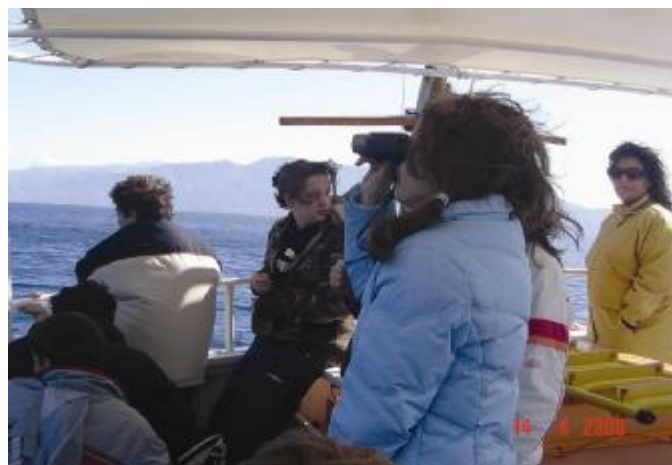
Εικόνα 11. Βλέποντας με τα κιάλια το νησί Σκορπιό

Τριήμερη περιβαλλοντική εκδρομή σε Μέτσοβο, Πρέβεζα, Λευκάδα, Πάργα, Άρτα, Γιάννενα... Βιντεοσκόπηση και φωτογράφιση της εκδρομής, καταγραφή εντυπώσεων, σκέψεων και συναισθημάτων