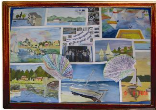
Εικόνα 12. αφίσα 120*110 cm