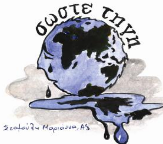
Εικόνα 1. Σκίτσο μαθήτριας