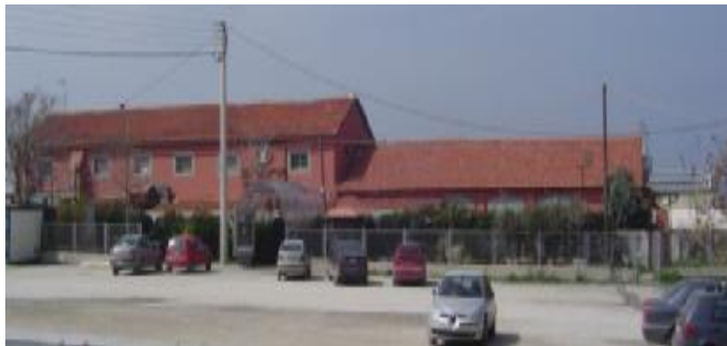
Εικόνα 19. “Shark” Από τη μεριά της θάλασσας: φωτογραφία τραβηγμένη από τη «σκάλα» της Καλαμαριάς