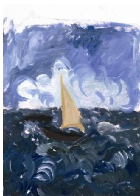
Εικόνα 7. Χ. Θεοδώρου Στέλλα Γραμμένου, Β1

Να μυρίσουμε το χώμα που μοσχοβολά Απ' το σιγανό τραγούδι της βροχής Και γίνεται ένα με τ' άρωμα