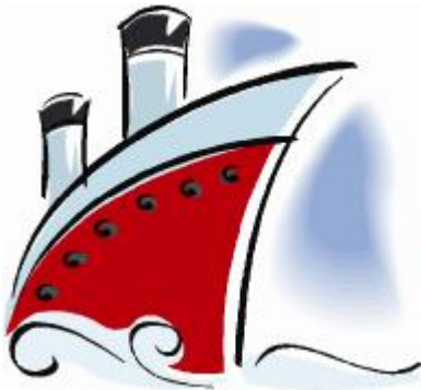
Εικόνα 8. Σκίτσο μαθητή

Ø Καταγραφή πλοίων, θαλασσινών ανέμων, σκίτσα