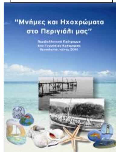
Εικόνα 14. Το έντυπο μας