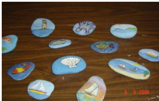
Εικόνα 13. Βότσαλα που μαζέψαμε από τη θάλασσα και τα ζωγραφίσαμε