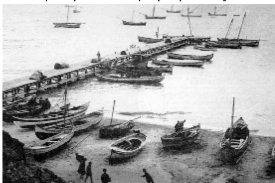
Εικόνα 16. Η σκάλα της Αρετσούς.(Ι.Α.Π.Ε)