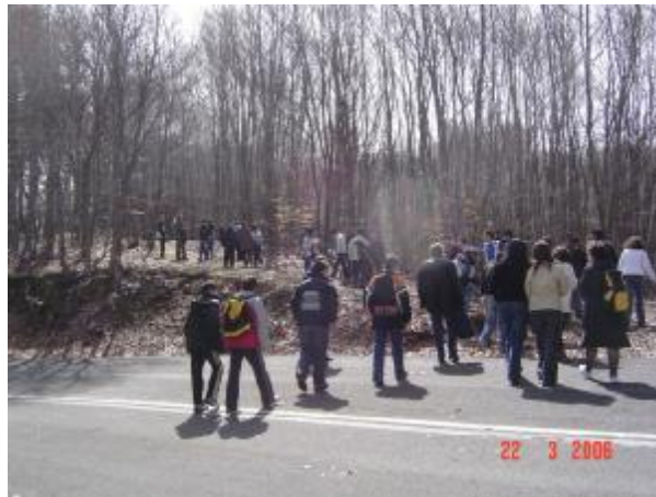
Εικόνα 10. Δασικό μονοπάτι στην Αρναία

Τριήμερη περιβαλλοντική εκδρομή σε Μέτσοβο, Πρέβεζα, Λευκάδα, Πάργα, Άρτα, Γιάννενα... Βιντεοσκόπηση και φωτογράφιση της εκδρομής, καταγραφή εντυπώσεων, σκέψεων και συναισθημάτων