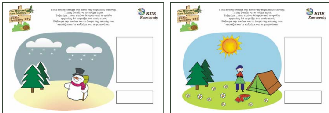
Φύλλα εργασίας 14γ & 14δ

III. Δημιουργούν ποιήματα ή μόνο δίστιχα σχετικά με τα «επιλεγμένα» φυτά τους και τις εποχές. Ο εκπαιδευτικός ίσως είναι σκόπιμο να δίνει τον πρώτο στίχο, τουλάχιστον στην αρχή όπως: