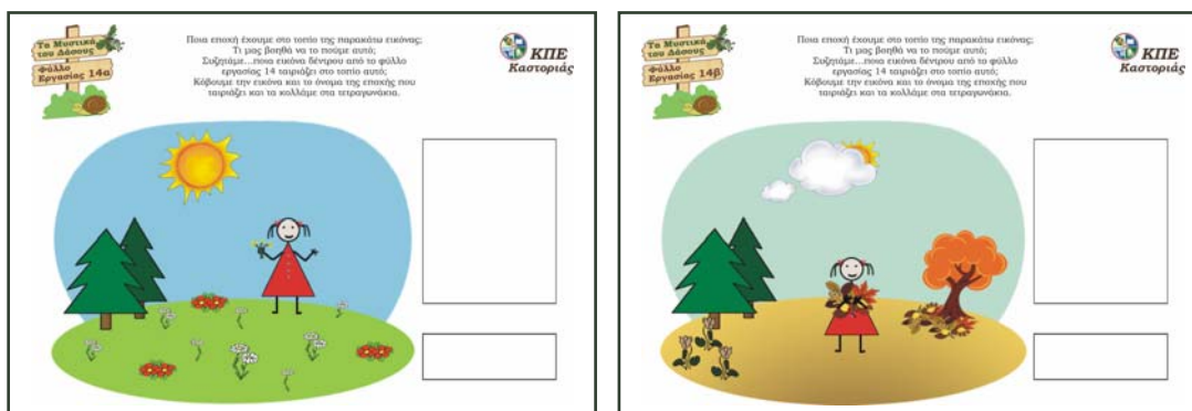
Φύλλα εργασίας 14α & 14β