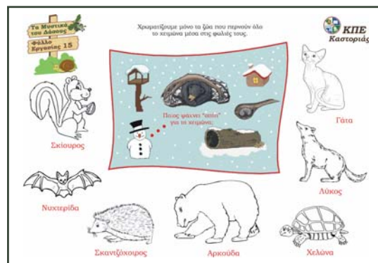
Φύλλο εργασίας 15

Στη συνέχεια παρουσιάζονται βιβλία με ανάλογες εικόνες. Τα παιδιά επίσης καλούνται να αυτενεργήσουν, να φανταστούν ότι είναι σκαντζόχοιροι ή αρκούδες το χειμώνα στο δάσος και να επινοήσουν τρόπους, σύμφωνα με τα παραπάνω, για να αντιμετωπίσουν την παγωνιά ή την έλλειψη τροφής. Τέλος εργάζονται στο φύλλο εργασίας 15 .