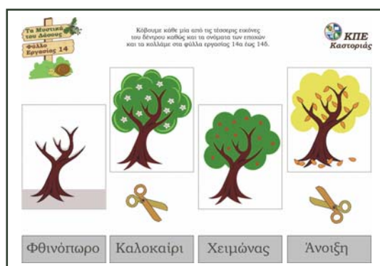
Φύλλο εργασίας 14

II. Εργάζονται στα φύλλα εργασίας 14, 14α έως 14δ