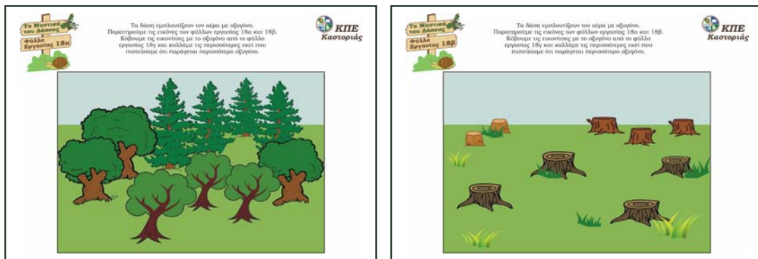
Φύλλα εργασίας 18α & 18β

Τα παιδιά εργάζονται στα φύλλα εργασίας 18α, 18β, 18γ.