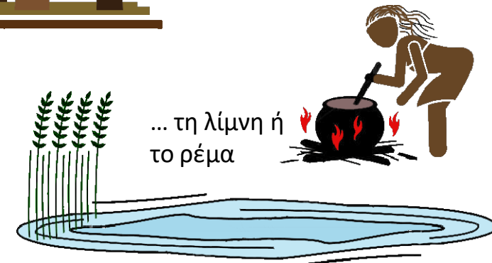
... τη λίμνη ή το ρέμα